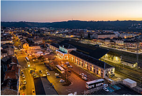
© Périgueux, Gare SNCF de nuit (Vue aérienne) <br>© Déclic & Décolle