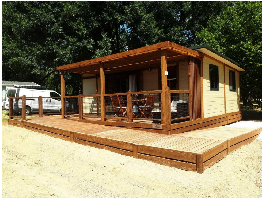
Nouveaux hébergements : chalet avec accessibilité personnes à mobilité réduite

Que ces travaux doivent permettre la montée en gamme du caractère naturel. Les hébergements envisagés seront complémentaires et qui ont remportés un franc succès :