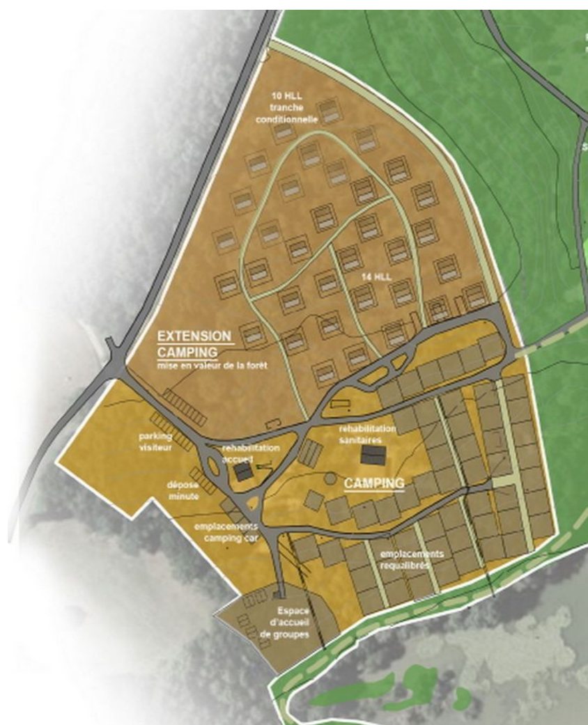
Plan esquisse de l'extension du camping