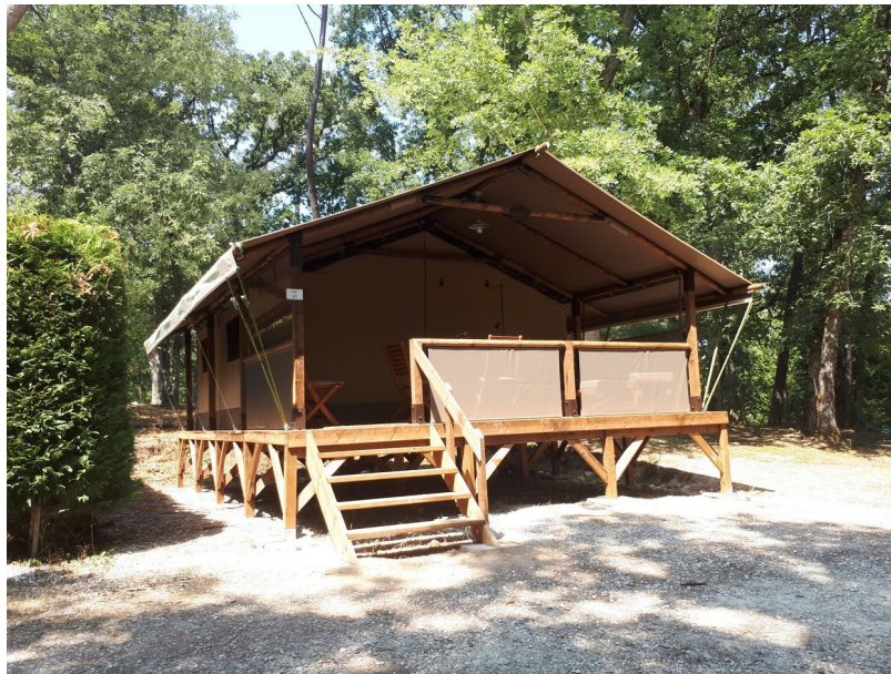
Nouveaux hébergements : tentes lodges

Que la réalisation de ces travaux pourrait être envisagée en 2022.