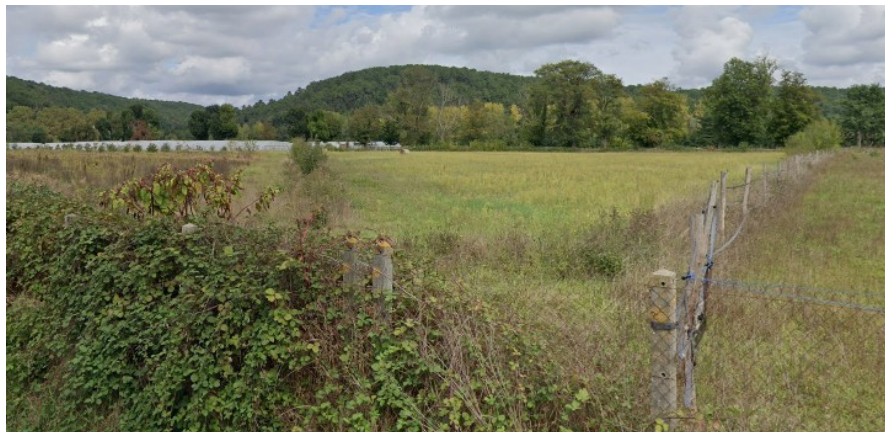
Vue depuis la route du Chambon sur la parcelle n°207

Considérant qu'il est donc proposé de vendre la parcelle compte-tenu des informations suivantes :