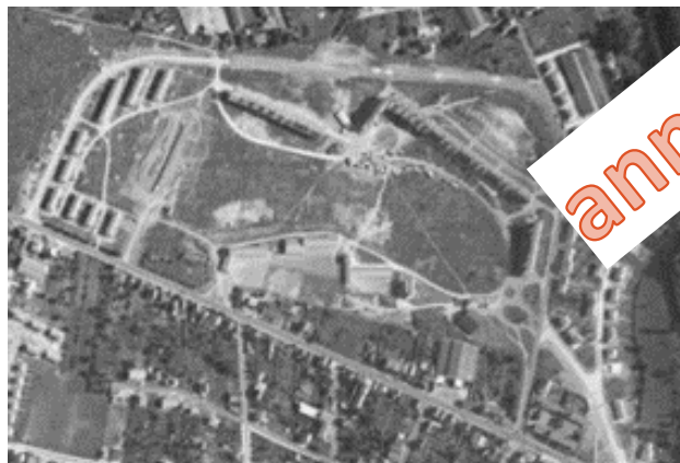
Vue aérienne 1958 avant construction de la résidence Eter

Le bâtiment était une copie conforme de la résidence Ebis située à l'Ouest du site ; celle-ci est conservée dans le cadre du projet de rénovation urbaine du quartier de Chamiers.