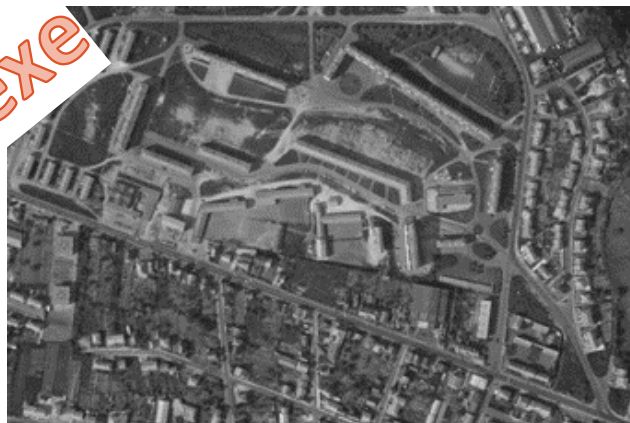
Vue aérienne 1965 après construction de la résidence Eter

Cette tranche de l'histoire du quartier et de celle de la France peut éventuellement être un fil rouge pour l'aménagement des futurs espaces nourriciers.