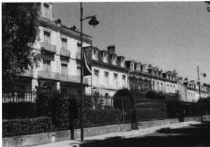
Les belles demeures des allées de Tourny vont être intégrées dans le nouveau plan de sauvegarde et de mise en valeur de Périgueux.

En septembre 2020 et février 2021, la Ville a organisé des réunions avec les habitants et les commerçants pour com-