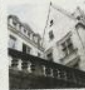
L'hôtel Estignard, bientôt en chantier.