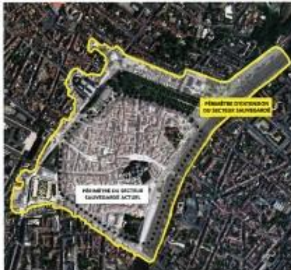
Au terme de la procédure de révision-extension du Plan de Sauvegarde et de Mise en Valeur (PSMV), le superficie du secteur sauvegardé sera presque doublé.

D'une superficie de 21,5 hectares, l'actuel secteur sauvegardé de Périgueux a été créé en 1970. Il est régi par un Plan de Sauvegarde et de Mise en Valeur (PSMV) approuvé en 1980.