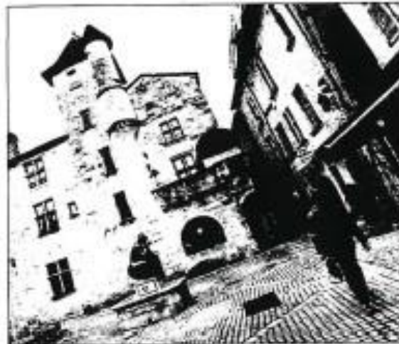
La maison du Pâtissier, place Saint-Louis, accueillera le premier atelier de travail réservé aux habitants, y compris les enfants.

« L'objectif est de poursuivre les échanges entamés à l'occasion de la réunion publique et de définir quelles sont les attentes des habitants : familles, locataires, Périgourdins et Périgourdines de tout âge, y compris les enfants », détaille la Ville.