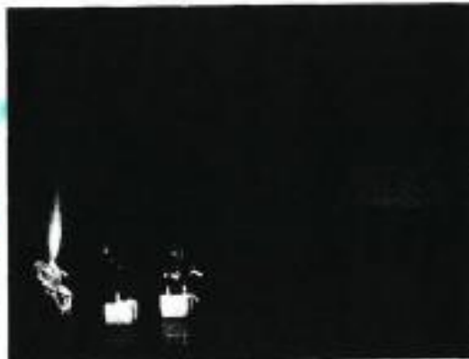
Le nouveau PSMV ne devrait entrer en vigueur que fin 2021 voire début 2022, selon l'architecte des bâtiments de France en charge du projet.

Le premier aura lieu avec les habitants des quartiers, le samedi 3 octobre de 15 heures à 17 h 30 à la maison du pâtissier, « le lieu est désormais officiel et confirmé », se félicite Delphine Labails. Pour permettre au plus grand monde de faire le déplacement,