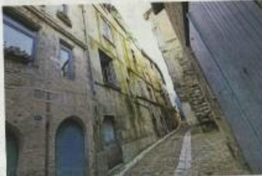
L'inventaire des 1 200 bâtiments du secteur sauvegardé va durer cinq ans.

Le plan de sauvegarde et de mise en valeur du secteur sauvegardé est en préparation. Ce plan de sauvegarde et de mise en valeur du secteur sauvegardé est en préparation.