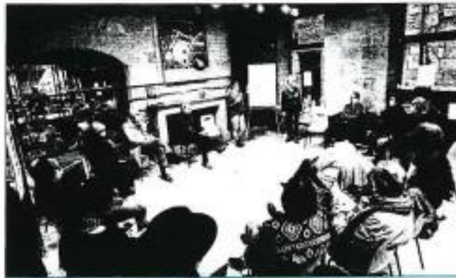
Les habitants ont été invités à donner leur avis sur la mise en valeur du secteur sauvegardé, samedi après-midi à la maison du patrimoine.

Boris KESSEYROTTE reportage@ladordogne.com