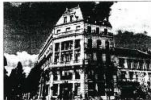
Les boulevards et ses bâtiments du XIX e siècle vont faire partie du secteur sauvegardé de Périgueux.

Quoi de mieux que d'en parler avec les premiers intéressés, à savoir celles et ceux qui vivent ou travaillent dans ce secteur. Voilà pourquoi la Ville organise, demain soir au théâtre, une réunion publique sur le sujet.