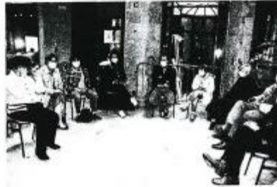
Deux ateliers de concertation avaient lieu simultanément dans la maison du Pâtissier, samedi après-midi.

Répartis en deux groupes, 25 habitants environ ont participé, samedi 3 octobre, aux premiers ateliers animés par le service urbanisme de la Ville de Périgueux et des élus, dans le cadre de la concertation sur le futur plan de sauvegarde et de mise en valeur (PSMV) du patrimoine. Cette nouvelle version du document prévoit une extension de son périmètre au Périgord du XIX e siècle, avec les boulevards, les allées Tourmy et la rive gauche de l'Isle (lire « Sud Ouest » des 23 et 25 septembre). Le PSMV encadre ce qui peut être fait, ou pas, en termes d'urbanisme. La municipalité souhaite y associer les habitants, pour anticiper par exemple des aménagements. Au fil des discussions, de grands thèmes de réflexion se sont dégagés : la lutte contre les nuisances sonores, la végétalisation des espaces, la gestion des déchets et la propreté. La concertation se poursuivra jusqu'en février 2021. Les prochains rendez-vous auront lieu à l'auditorium Maubert du Théâtre, avec les commerçants ce lundi 5 octobre de 8 à 10 heures, avec les professionnels du bâtiment lundi 12 octobre de 18 h 30 à 20 heures, et avec les notaires et agents immobiliers, mercredi 18 novembre de 18 h 30 à 20 heures. Chaque Périgourdin peut continuer à contribuer à la démarche sur le site de la mairie, perigueux.fr (cliquer sur