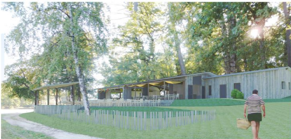
PC 6 - DOCUMENT GRAPHIQUE D'INSERTION GUINGUETTE

Le Grand Périgueux se charge de l'ameublement intérieur et extérieur de la guinguette. La décoration et l'ambiance devront respecter une certaine simplicité et harmonie en lien avec la nature du site, avec un style épuré et nature, en privilégiant des tons clairs non marqués.