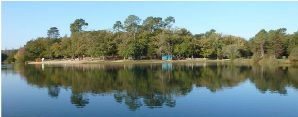
PC 8 - PHOTO ENVIRONNEMENT LOINTAIN GUINGUETTE - SANITAIRES PUBLICS

La guinguette se situe dans la base de loisirs de Neufont à Saint-Amand de Vergt. Le site du projet se trouve au bord du lac de Neufont. Le terrain se compose d'arbres de type chênes et pins maritimes.