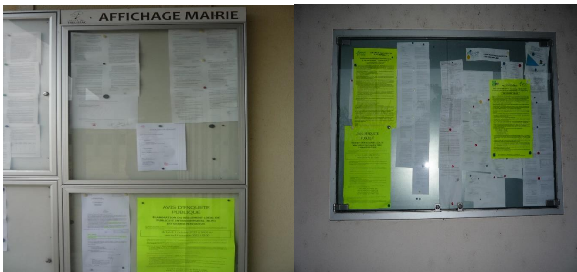
Siège du Grand Périgueux