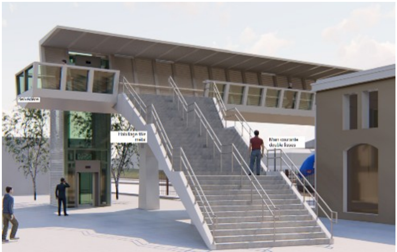
Arrivée de la passerelle sur le parvis de la gare

Que pour rappel, ce projet comprend principalement la réalisation d'une nouvelle passerelle et le réaménagement complet du parvis de la gare.