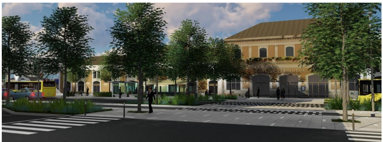
Vue du parvis réaménagé