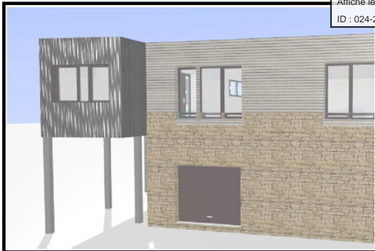
Plan du projet :

Considérant que les travaux seront réalisés à compter de juillet 2022 pour une durée de 5 mois.